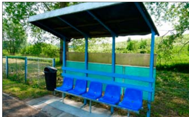
dla operacji, które odpowiadają warunkom przyznania pomocy w ramach działania Odnowa i rozwój wsi.