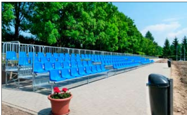
rów Wiejskich na lata 2007–2013 ramach działania 4.1/413 „Wdrażanie lokalnych strategii rozwoju” PROW 2007–2013